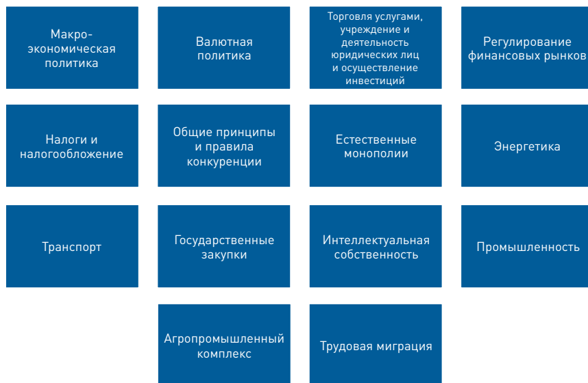
Рис. 3.1. Разделы Договора о ЕАЭС, регулирующие единое экономическое пространство

Разделом XIII регулируется согласованная макроэкономическая политика в рамках Союза, цель которой — сбалансированное экономическое развитие государств-членов. Среди основных ее направлений — реализация интеграционного потенциала ЕАЭС и конкурентных преимуществ каждого государства-члена, создание условий для повышения внутренней устойчивости их экономик и устойчивости к внешнему