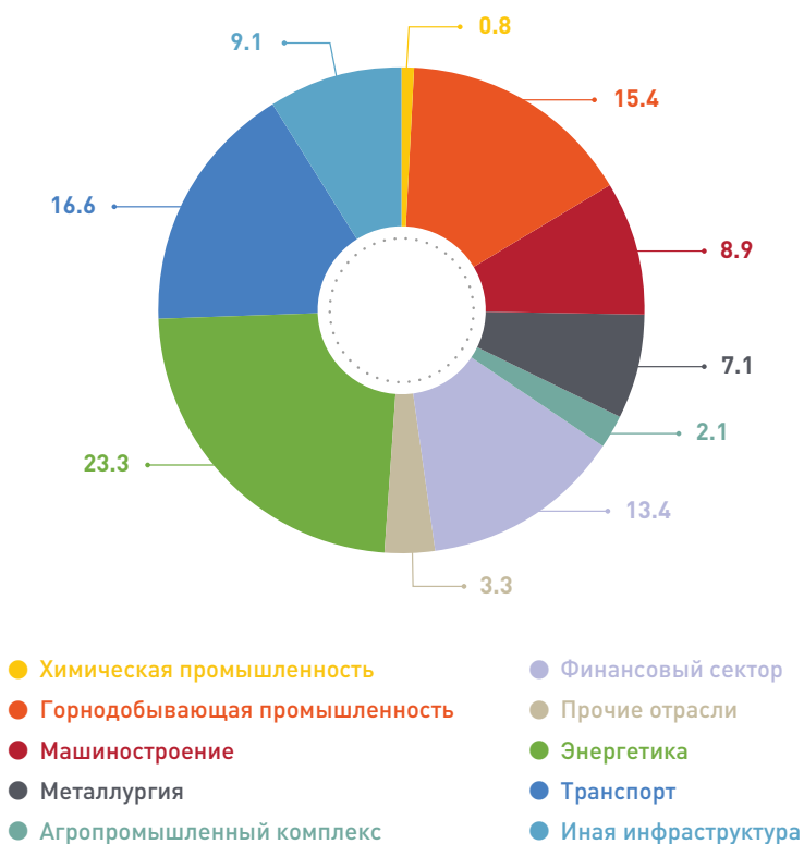
Рис. 3.4. Отраслевая структура текущего инвестиционного портфеля ЕАБР в 2016 году, %