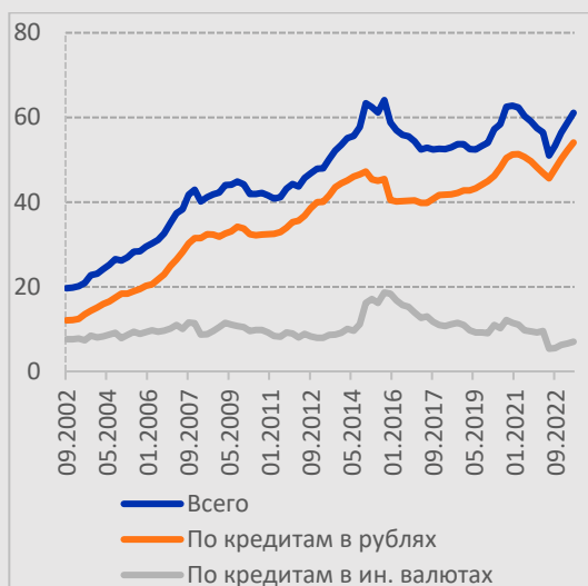
Рисунок 5. Долг по кредитам, % ВВП