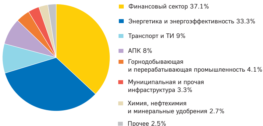
Рисунок 2. Отраслевая принадлежность утвержденного инвестиционно-проектного финансирования

и СИБ о таких формах финансирования не сообщали.