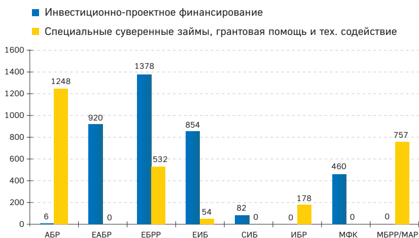
Рисунок 1. Объем утвержденного финансирования во II полугодии 2012 года, $ млн

Лидером по объему подобного финансирования традиционно стал АБР с долей 45% на сумму свыше $1 млрд 248 млн (20 проектов). ЧБР