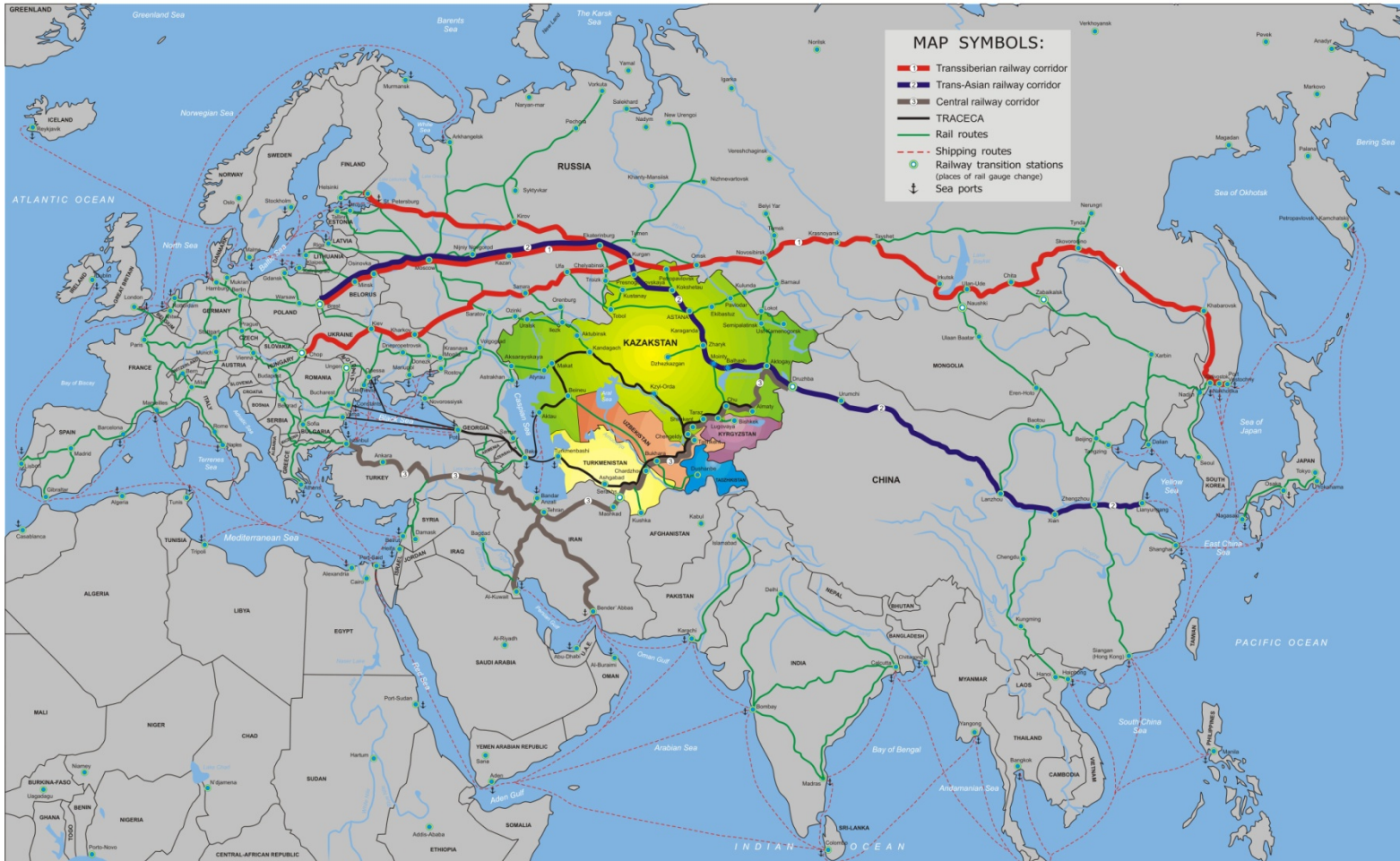
MAIN EURO-ASIAN CORRIDORS