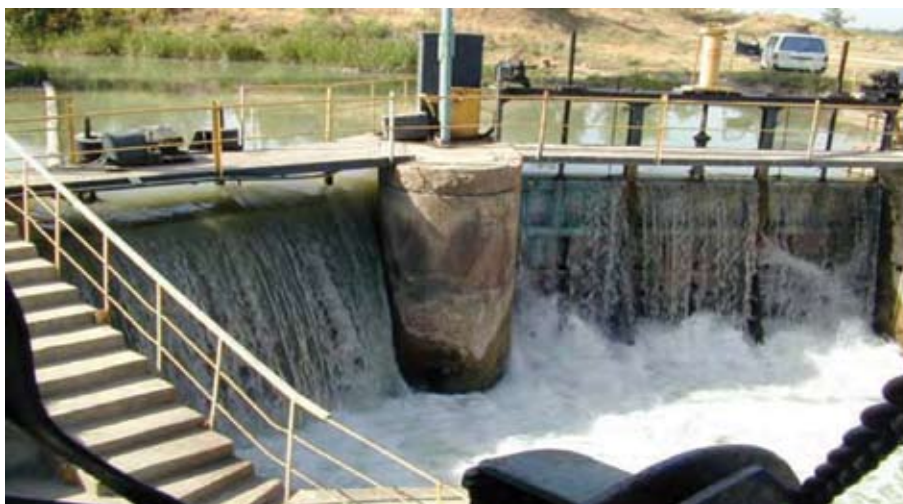
Рисунок 2.2. МГЭС на реке Аламедин

До строительства крупных ГЭС и создания энергосистем в республике насчитывалось около 200 малых станций. Практически все они были выведены из эксплуатации, в настоящее время имеется всего 10 действующих МГЭС.