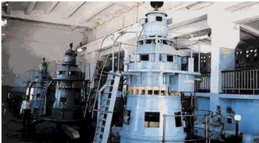
Рисунок 2.1. Машинный зал Каратальской ГЭС

Алматинский каскад ГЭС расположен в Алматинской области, на реках Большая и Малая Алматинка. Состоит из 11 малых гидроузлов общей мощностью 49.15 МВт, введен-