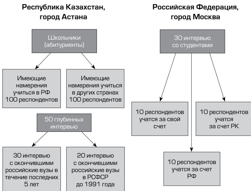
Рисунок 1 Структура выборки проведенного исследования

Анализ научной литературы, статей местной прессы в двух изучаемых регионах (Астана и Москва) дополнил картину, сложившуюся по результатам интервью и опроса.