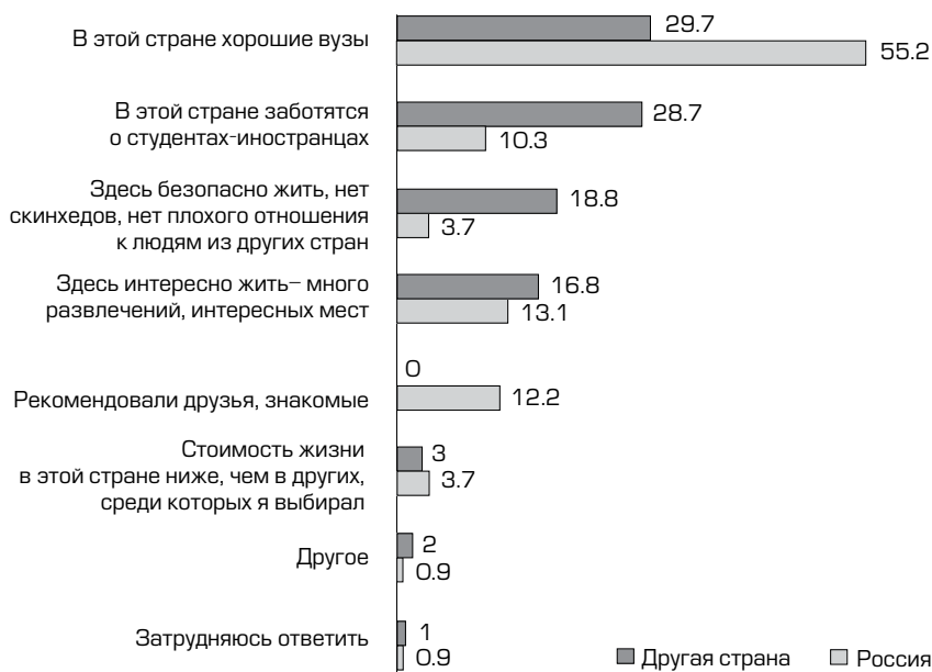
Рисунок 2 Распределение казахстанских школьников по причинам выбора страны для обучения (%)

Исследование показало, что в качестве альтернативы учебе в Российской Федерации казахстанские школьники чаще всего рассматривают Великобританию, США, Чехию, Турцию и Японию. Выбор страны обусловлен наличием в ней хороших вузов (обе группы школьников – и те, кто хотят учиться в РФ, и те, кто хотят учиться в другой стране, поставили это условие на первое место). Но те, кто хочет поехать в РФ, на второе по важности место ставят культурный фактор («здесь интересно жить – много развлечений, интересных мест»), а на третье – советы друзей, знакомых, и только на четвертое – заботу о студентах-иностранцах. Напротив, те, кто хочет поехать на учебу не в РФ, именно заботу о студентах-иностранцах в стране предполагаемой учебы ставят на второе место. Следом у них идет