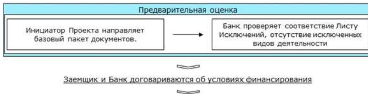
Рисунок. Процедура экологического и социального анализа Проекта

4.4.4. Банк собирает всю доступную информацию о Проекте, полученную в соответствии с процедурой мониторинга, описанной в Положении, и готовит мониторинговый отчет об экологических и социальных эффектах Проекта.